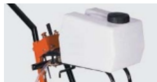
REZERVOR APA DETASABIL DE 20 LITRI DIN POLIURETAN