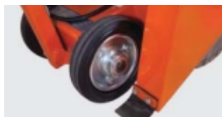
ROTI CU RULMENTI SIGILATI